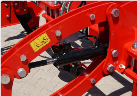
Kolay derinlik ayarı için Çift piston