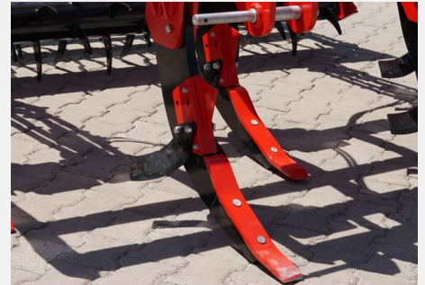
Pim kesen emniyet sistemli ayak